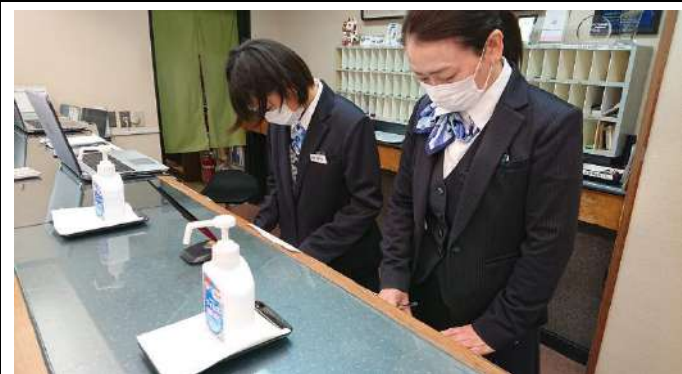
全従業員のマスク着用を徹底