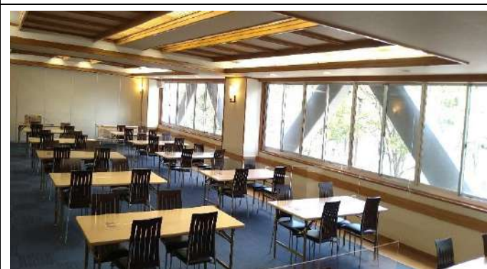
食事会場における十分なスペースの確保