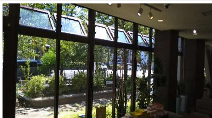
各所における換気の徹底