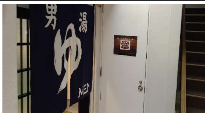
各施設に対策を掲示