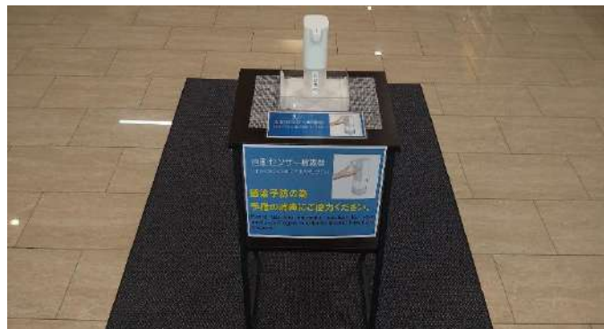
各パブリックスペースに消毒液を設置