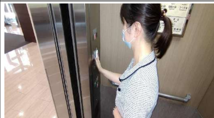
エレベーター等の定期的な消毒作業